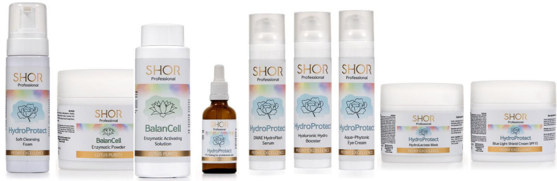
Hoidossa käytettävät tuotteet Shor Professional