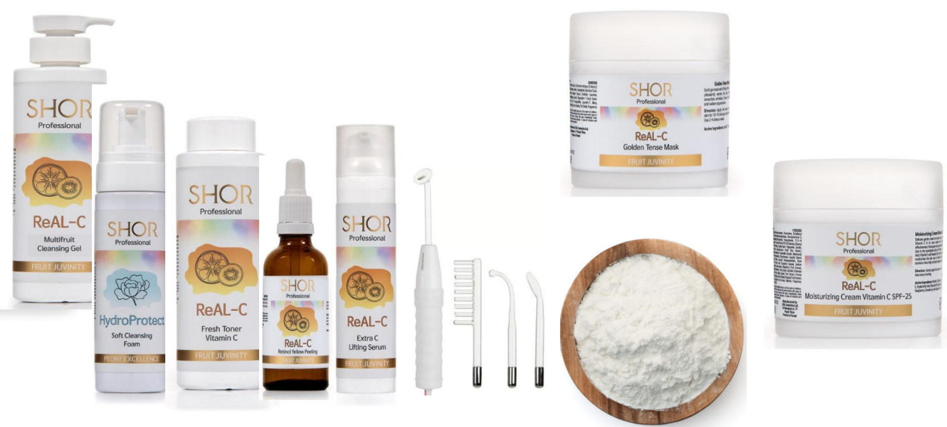
Hoidossa käytettävät tuotteet Shor Professional